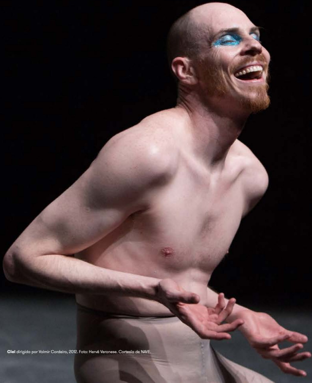
Ciel dirigida por Volmir Cordeiro, 2012.