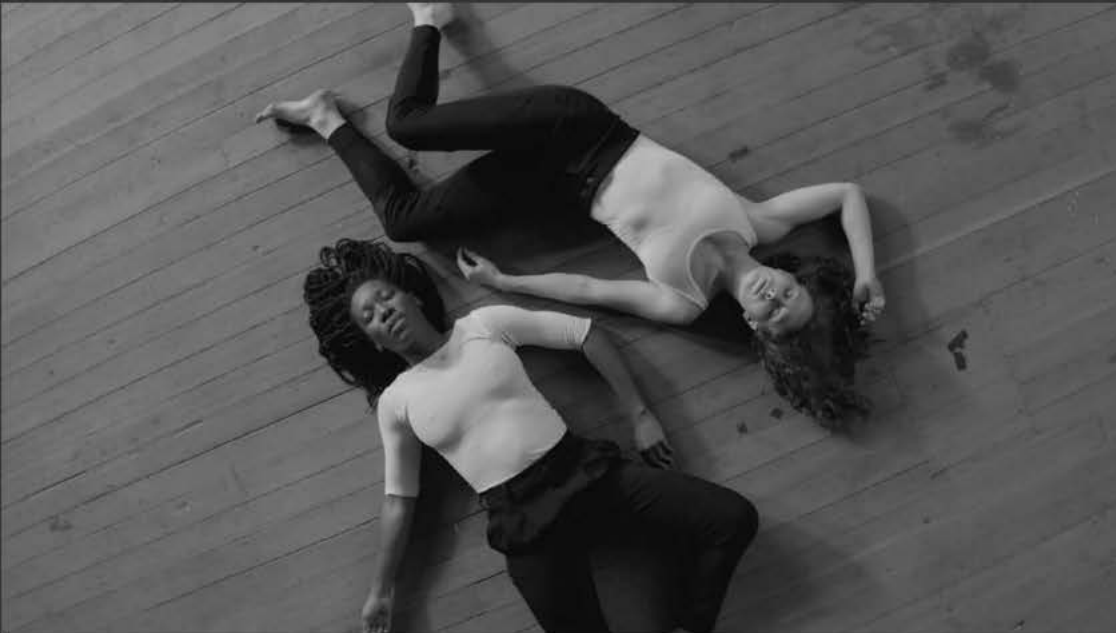
The Box dirigida por Tom Bird. Vitamin String Quartet + LA Contemporary Dance Company.